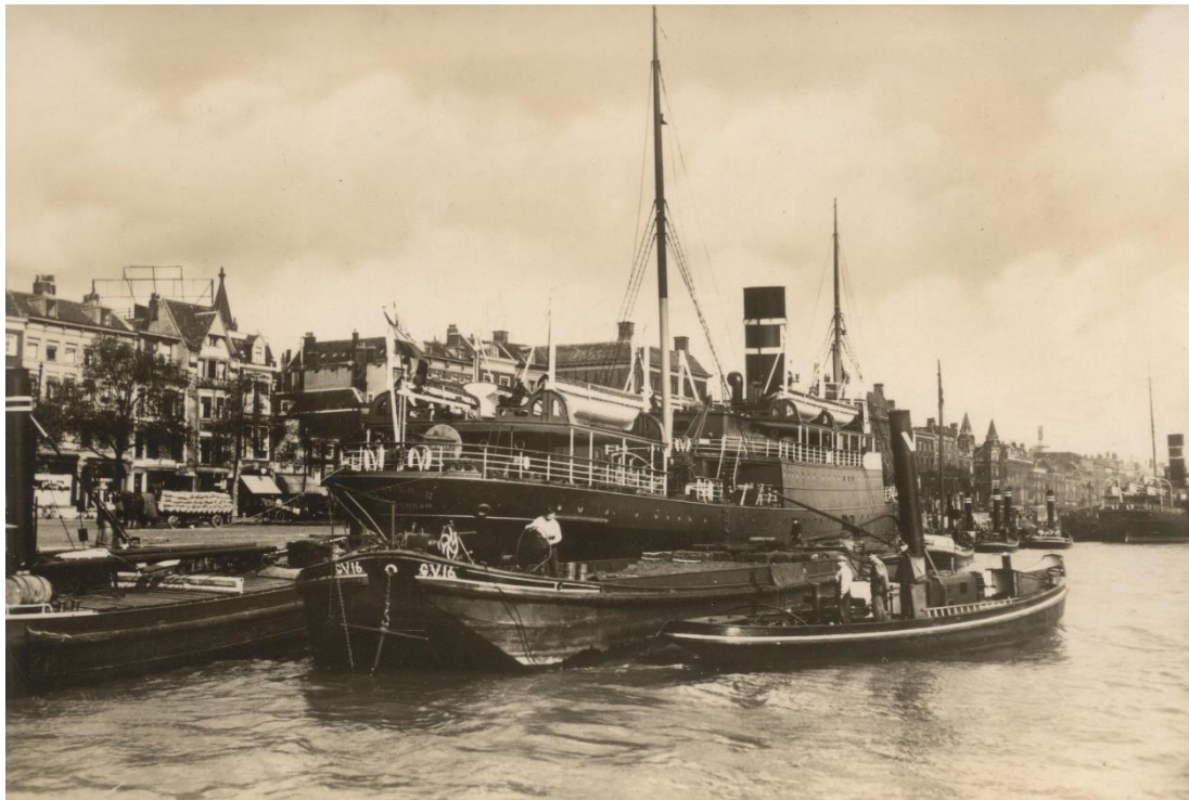
280 vastberaden Nederlanders die uit handen van de Duitse bezetter wisten te blijven in de meidagen van 1940, maakten op 29 mei met de Batavier II, een omgebouwd passagiersschip, de oversteek vanuit Cherbourg naar Groot-Brittannië van waaruit zij de strijd zouden voortzetten.

Vliegvelden waren voor Duitsland geprefereerde doelwitten om te vernietigen. Op 10 mei namen drie Messerschmitts het Souburg Vliegpark bij Vlissingen onder vuur, wat weinig materiële schade veroorzaakte maar wel ontreding bij de aanwezige troepen. Orders werden gegeven, vervangen en weer ingetrokken. In de volgende uren en dagen vonden nog meer aanvallen plaats. Op 14 mei kwam er een bevel tot evacuatie. 23 Fokker lestoestellen stegen op richting het Franse Berck-sur-Mer, met een tussenstop op het vliegveld aan de kust van Cap Griz Nez. Omdat er geen landkaarten beschikbaar waren, zouden de piloten op een hoogte van 200 meter vliegen. Onderweg maakten vier toestellen een noodlanding. Een autocolonne bracht iedereen die niet met de vliegtuigen meekon naar de eindbestemming.