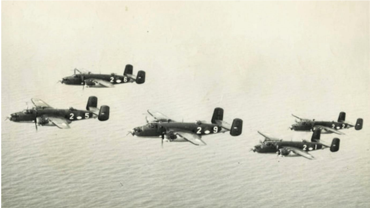
Mitchells in formatie

Zelfs de terugkeer naar de eigen basis verliep wel eens problematisch en eindigde soms rampzalig. In een van zijn vele interviews die hij in zijn latere leven gaf, vertelde Hissink over de retour van een operationele missie op hun Engelse vliegbasis. Zijn crew vloog achter de nummer 1, een Engelse Mitchell. “Op het moment van de touch down op de baan, explodeerde die Engelse kist - inclusief de bemanning - doordat een ‘hang up’ (een op scherp staande bom die tijdens het bombarderen was blijven hangen) losschoot door de landingsklap en afging.” Manschot had meer geluk. In de nacht van 14 op 15 juni 1944 werd zijn toestel bijna neergeschoten. Door hevige uitwijkmanoeuvres kon hij ontsnappen, maar na het landen merkte hij dat een van de veronderstelde gedropte bommen was blijven hangen. Hij had geluk, want ze bleef intact.