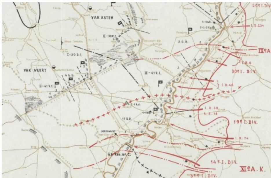
Schets toestand op 10 mei 1940

gat van ongeveer acht kilometer. Het 4 e Grensbataljon (4 G.B.) vormt het middelste bataljon van dat vak Weert. Hun stelling loopt langs de Zuid-Willemsvaart, links aangeleund door het eerste bataljon van het 30 ste Regiment Infanterie (I-30 R.I.), rechts door de 2 de Afdeling van het 41 ste Regiment Infanterie (II-41 R.I.).