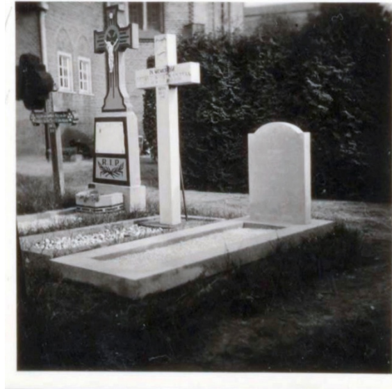
'Gevallen voor het Vaderland'