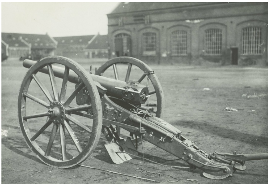
8 Staal

4 G.B. bestaat uit de Staf met Verbindings-Afdeling, drie tirailleurscompagnieën, twee secties zware mitrailleurs, vier stukken pantserafweergeschut (pag, met kaliber van 4,7 cm), vier 2 cm geweren tegen pantserdoelen (t.p.) en een sectie mortieren. Verder is ingedeeld, ter beschikking van de Bataljons-Commandant (B.C.), 1 ste Afdeling van het 20 ste Regiment Artillerie (I-20 R.A.), bestaande uit twaalf stukken 8 Staal (geschut met kaliber van 8 cm). Commandant is majoor Fortanier. Het is zijn verslag dat een belangrijke bron voor dit artikel is.