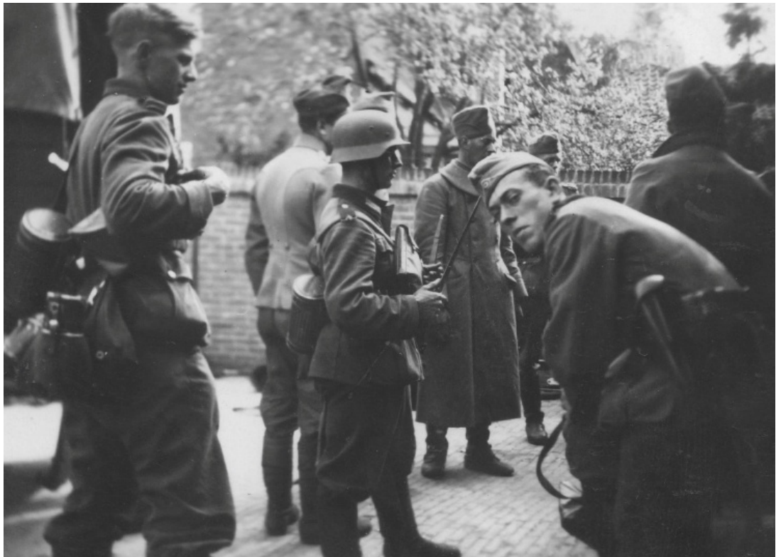
Nederlandse krijgsgevangenen en Duitsers bij de voormalige Boerenbond. Met dank aan Bert-Jan Dierink.