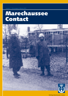
Foto omslag: 1960 Dienstplichtig, kille klus in Tuindorp-Oostzaan