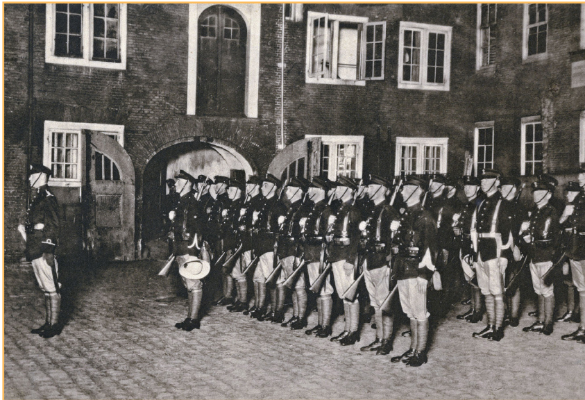
Inspectie Marinierskazerne Oostplein 1929.