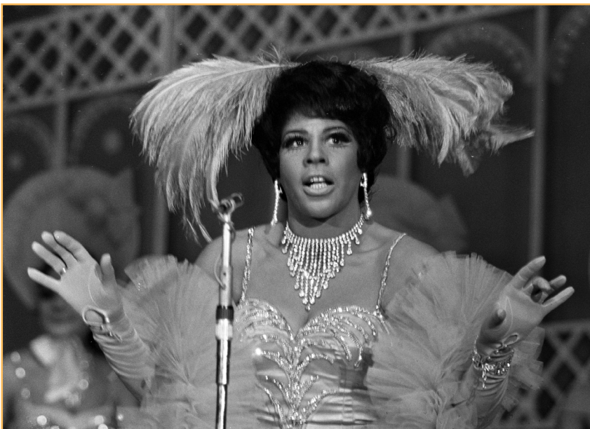
Milly Scott tijdens de generale repetitie Snip en Snap Revue in Amsterdam 16-12-1969.