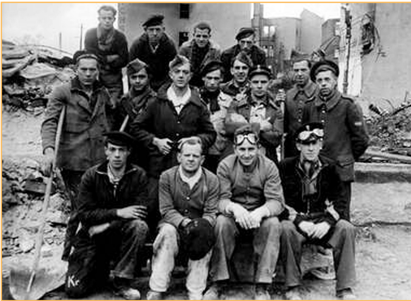
Krijgsgevangenen van Stalag V-a, Ludwigsburg.