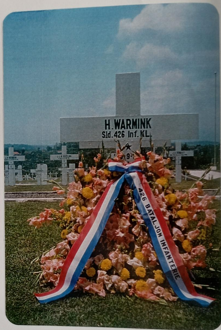
Legernr. 280920097, geboren te Gasselte, gesneuveld 18-05-1949 te Bodeh.