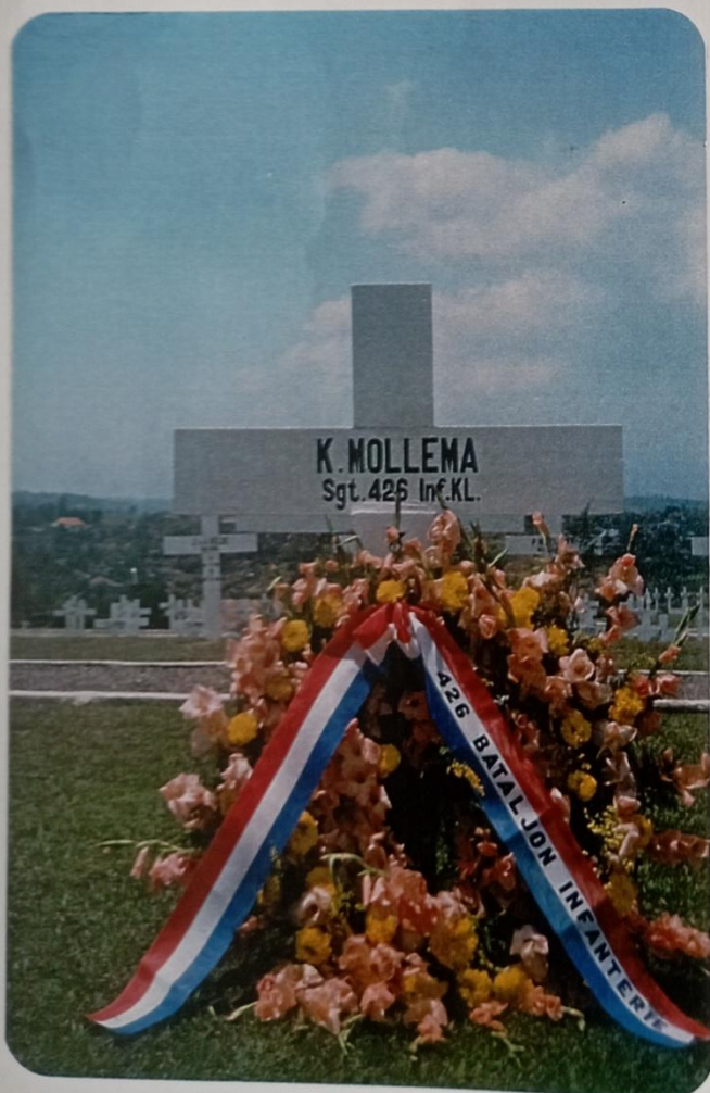
Legernr. 260718058, geboren te Ulrum, gesneuveld 03-06-1949 te Gamping.