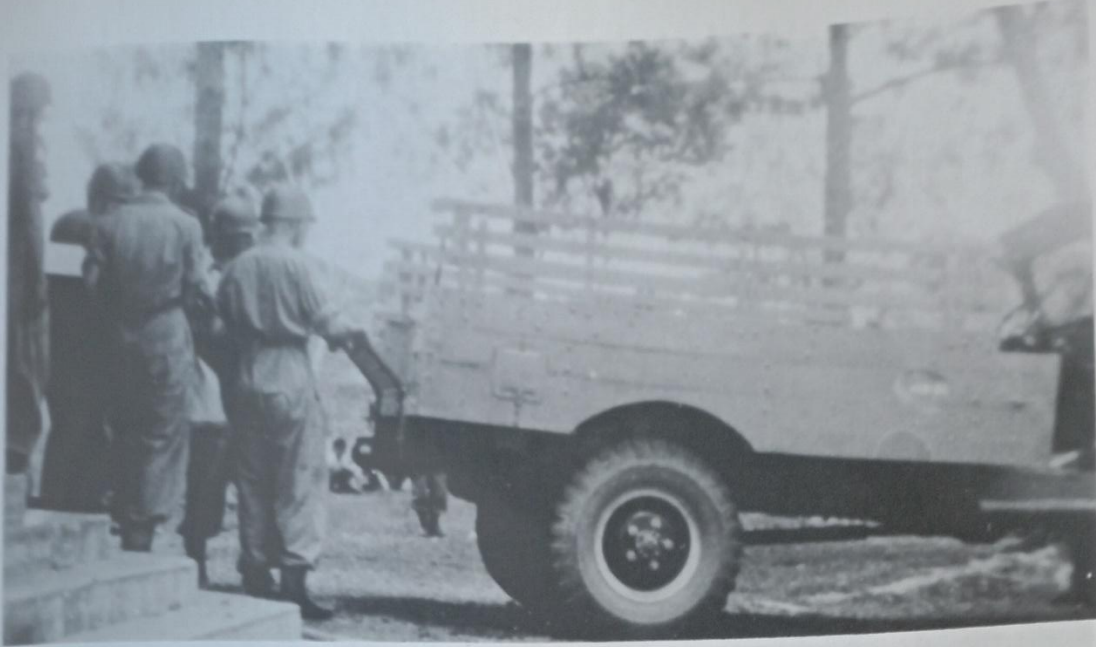
Een kameraad begraven