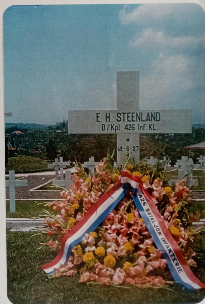
Legernr. 270614175, geboren te Den Haag, overleden 17-10-1949 te Semarang.