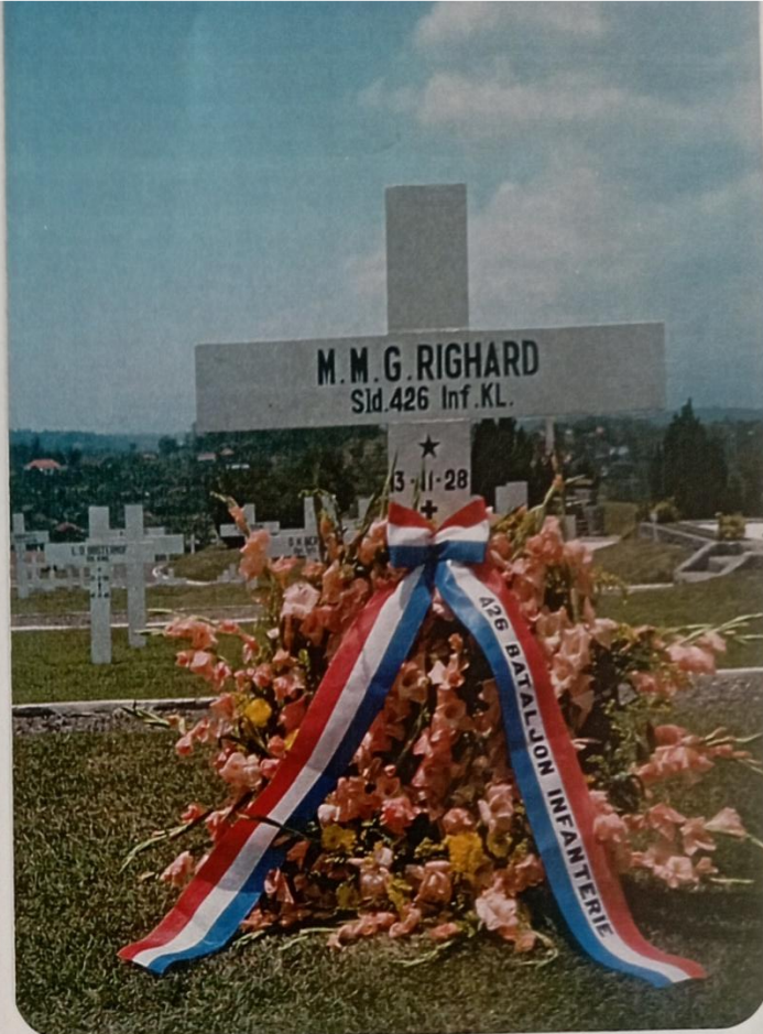
Legernr. 281113187, geboren te Warnsveld, gesneuveld 06-06-1949 te Padokan.