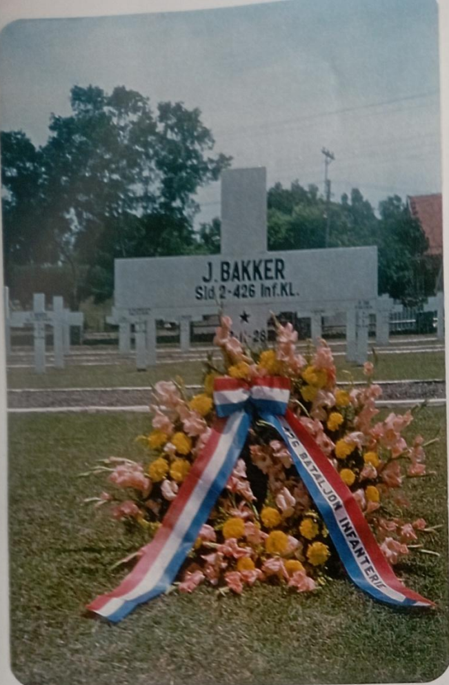
Legernr. 281129092, geboren te Wildervank, gesneuveld 29-04-1949 te Kalioerang.