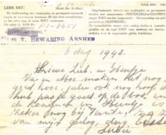
Brief van ouders aan kinderen uit Huis van Bewaring