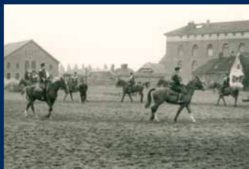
'Rijdschool in de Boreelkazerne te Deventer 1941/1942'