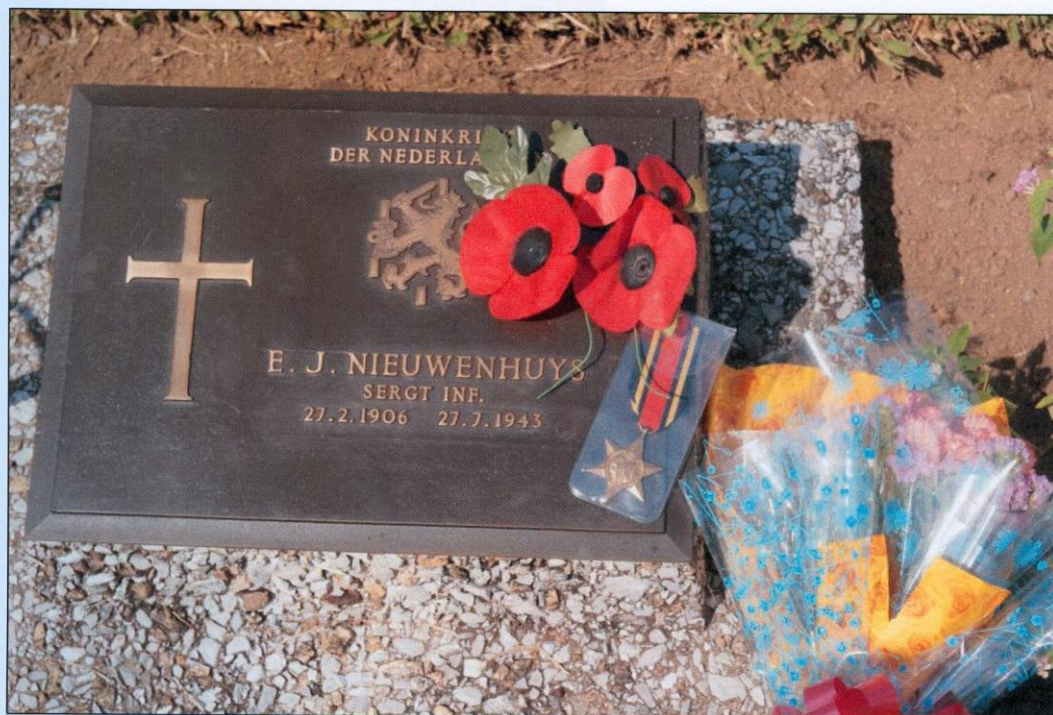
Klaprozen en eremedaille ook namens mijn broers en zusje op het graf van onze vader gelegd