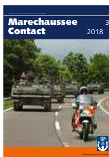
Foto omslag: juli 2004, Vogelsang (D), colonnebegeleiding