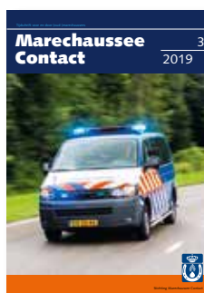
Foto omslag: 2016, Oirschot

Marechaussee Contact verschijnt zes keer per jaar in de laatste week van februari, april, juni, augustus, oktober en december. Mocht u het blad niet hebben ontvangen, stuur dan een e-mail naar redactie@marechausseecontact.nl . We sturen het u alsnog toe.