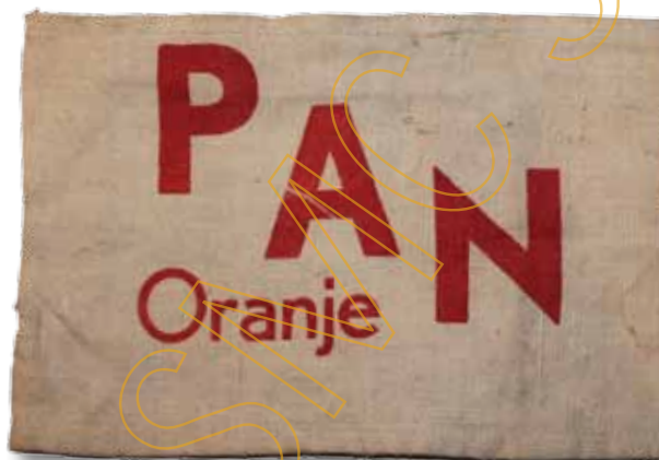
Armband van de Partisanen Actie Nederland