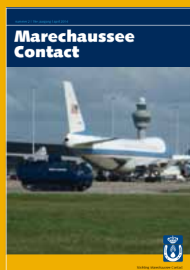
Foto omslag: De YPR van de Koninklijke Marechaussee beveiligd Air Force One op Schiphol tijdens de Nuclear Security Summit (zie pagina 3)