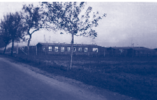
Kamp Lahde (zicht op administratie- en wachtbarakken)

*) Hatert en Neerbosch zijn nu stadswijken van Nijmegen