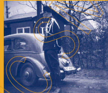
Doorniaatpost Millingen a/d Rijn, voorjaar 1940