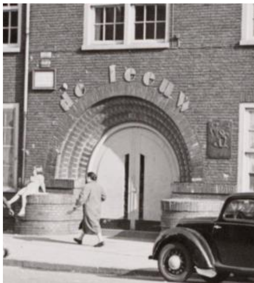
Na-oorlogs gebouw De Leeuw met de plaquette. Foto: Stadsarchief Amsterdam Beeldbank R.O. (1955)

De 25 opgeroepen leden van sectie 2 moesten die vierde mei zelf voor warme kleding, wandelschoenen en brood voor twee dagen zorgen. Zij moesten ook zelf de weg naar hun hoofdkwartier aan de Nieuwe Heerengracht zoeken. Bij binnenkomst ontvingen zij hun uitrusting: blauwe overall, (vooroorlogse) helm en wit-oranje armband met de opdruk "Amsterdam" en een vuurwapen, veelal een van de zeventien stenguns. Verlichting en verwarming waren daar niet meer aanwezig en de verzetsgroep moest