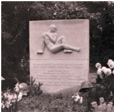
Monument gevallen jongen

In juli 1946 kwam een grafmonument voor hun gemeenschappelijk graf op Zorgvlied gereed, gemaakt door beeldhouwer Marius van Beek voor een bedrag van 150 gulden, ingezameld door de oud-strijdmakkers van Linie Oost.