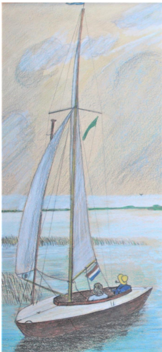
Gelukkige dagen op de Kagerplassen (1942) Tekening voor Truus door Herman de Kok