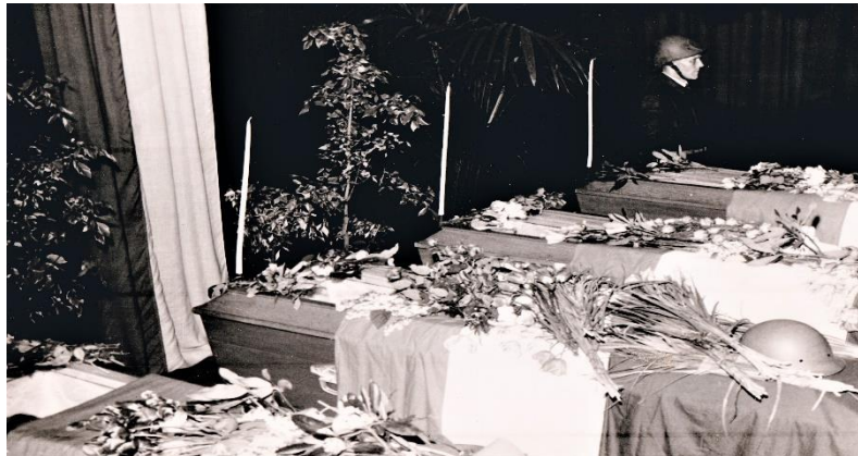
Opbaring van de 4 vier gesneuvelde verzetsstrijders met de erewacht van de BS

De gevangen genomen, ongewapende BS'ers werden door de Grünen opgesloten in de Marinekazerne, waaruit zij op last van de Duitse Marinecommandant de volgende dag werden vrijgelaten.