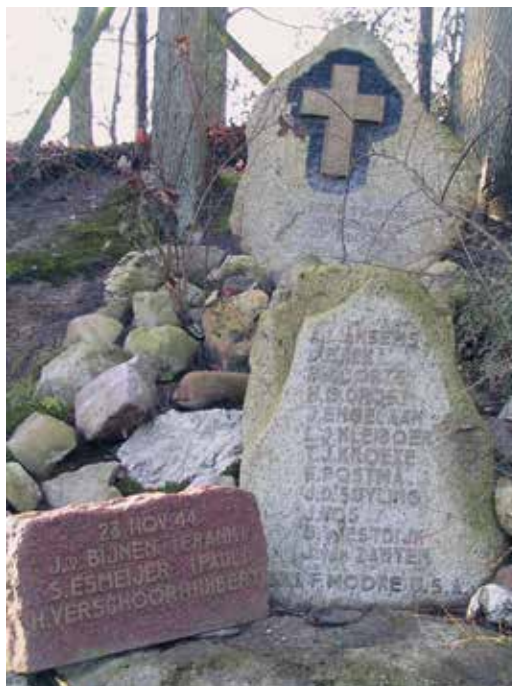
‘De Zwerfkeien aan de Frankenlaan’ Bij de Koning Willem III kazerne in Apeldoorn

Het monument is geadopteerd door Basisschool “De Wegwijzer” uit Apeldoorn en ieder jaar wordt er een herdenking gehouden die wordt georganiseerd door de Stichting Herinnering LO-LKP.