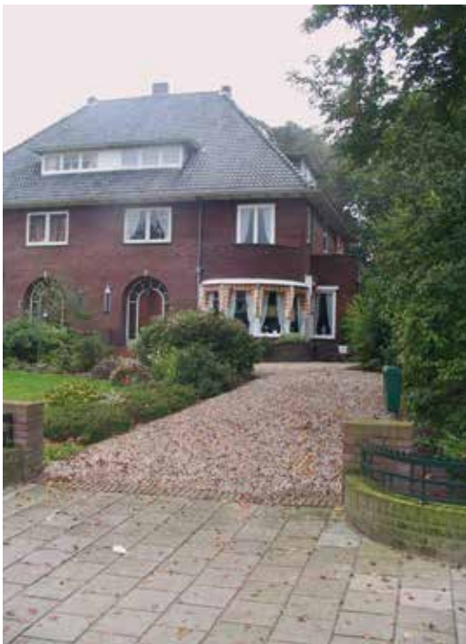
Kerkewijk 179 (nu nr. 147)