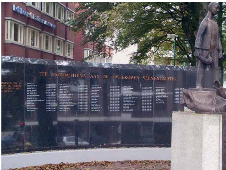
Monument voor de gevallen, station Veendaal centrum