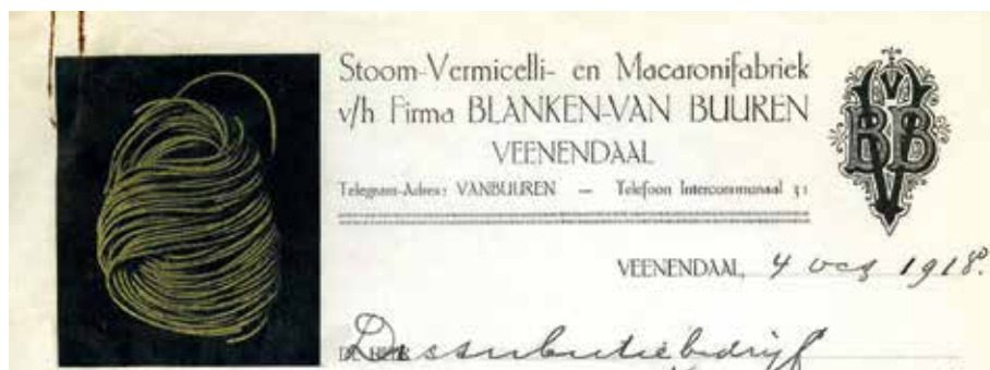
Briefhoofd Stoom Vermicelli en Macaronifabriek voorheen Blanken-Van Buuren