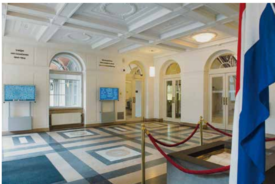
Erelijst gevallen bij de Tweede Kamer 24)