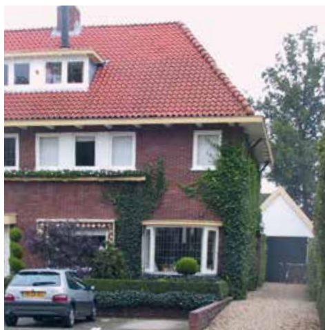
Kerkewijk 149 (nu nr. 119)