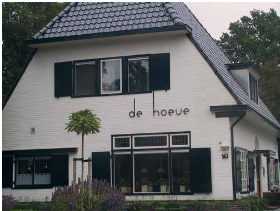
Kerkewijk 173 (nu nr. 141)