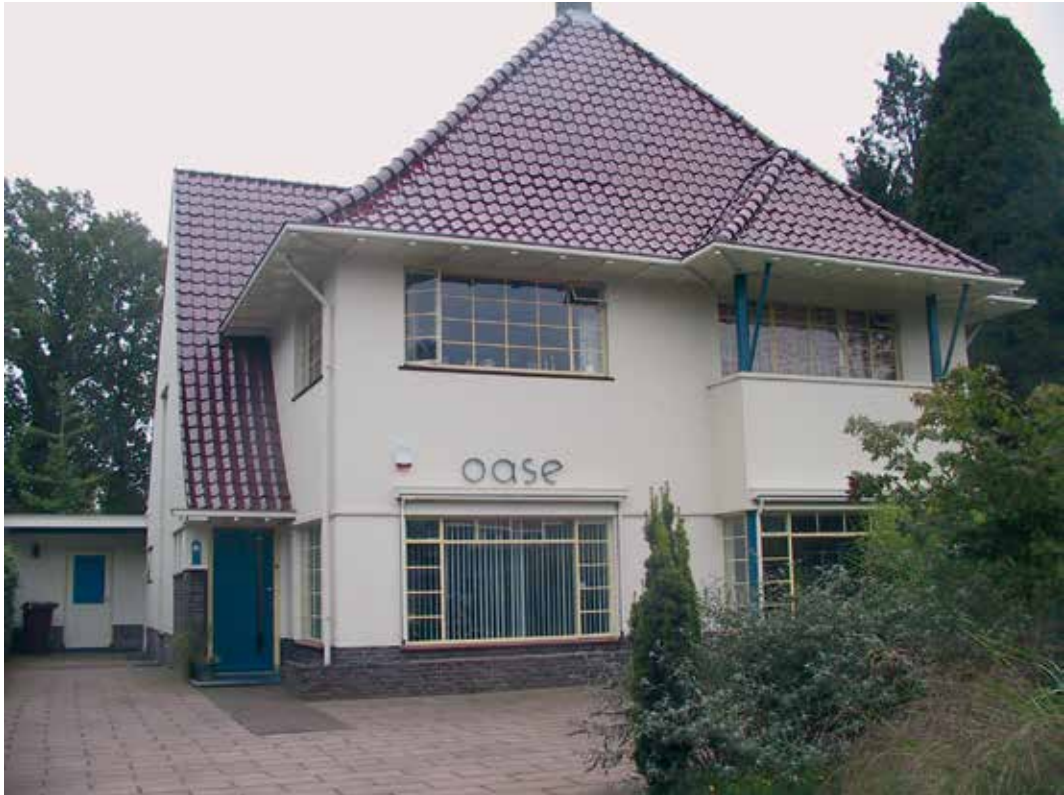
Kerkewijk 175 (nu nr. 143)

Ook in dit huis waren Duitsers gestationeerd. Hoge Duitse officieren van de Wehrmacht hadden zich de eetkamer en 2 slaapkamers toegeëigend.